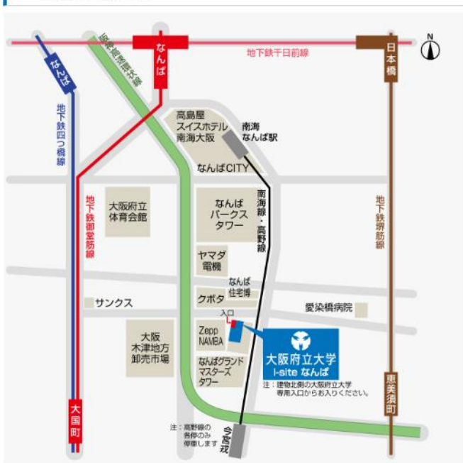
I-siteなんば 交通アクセス図