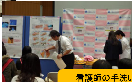
看護師の手洗い方法に ついてのミニ講義